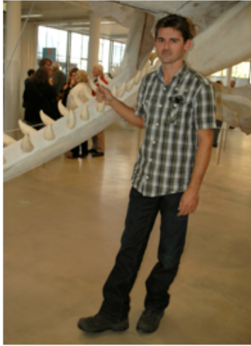
... en nu allebei samen.

Heeft u wel eens andere potvisskeletten in elkaar gezet? 'Ja. Het oudste skelet ligt op Texel. Buiten, voor een museum. Het is 60 jaar oud.'