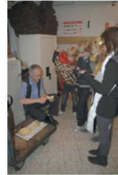
De beloofde meloen.

Vindt u het vervelend dat we deze vragen stellen? 'Nee, helemaal niet. Het is juist heel erg leuk. Mijn werk is mijn hobby. Ik kan er uren over praten.'